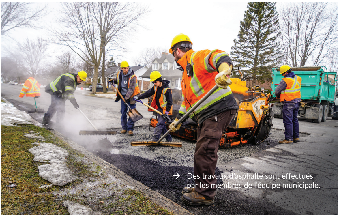
→ Des travaux d'asphalte sont effectués par les membres de l'équipe municipale.

Le PQI, qui intègre les orientations et priorités du Conseil, constitue ainsi un outil de planification primordial, permettant d'adopter une approche globale et cohérente en matière de développement urbain.