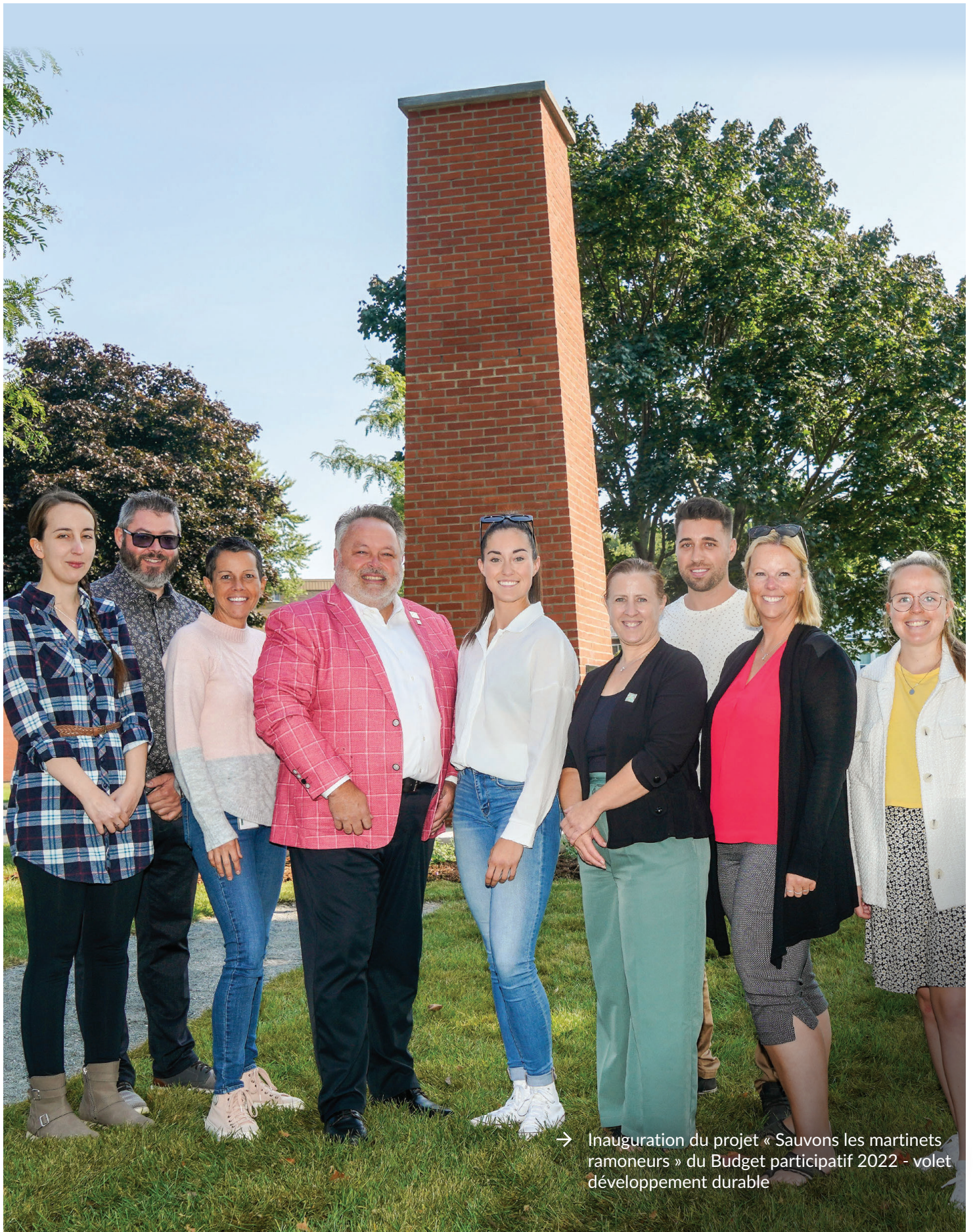
→ Inauguration du projet « Sauvons les martinets ramoneurs » du Budget participatif 2022 - volet développement durable